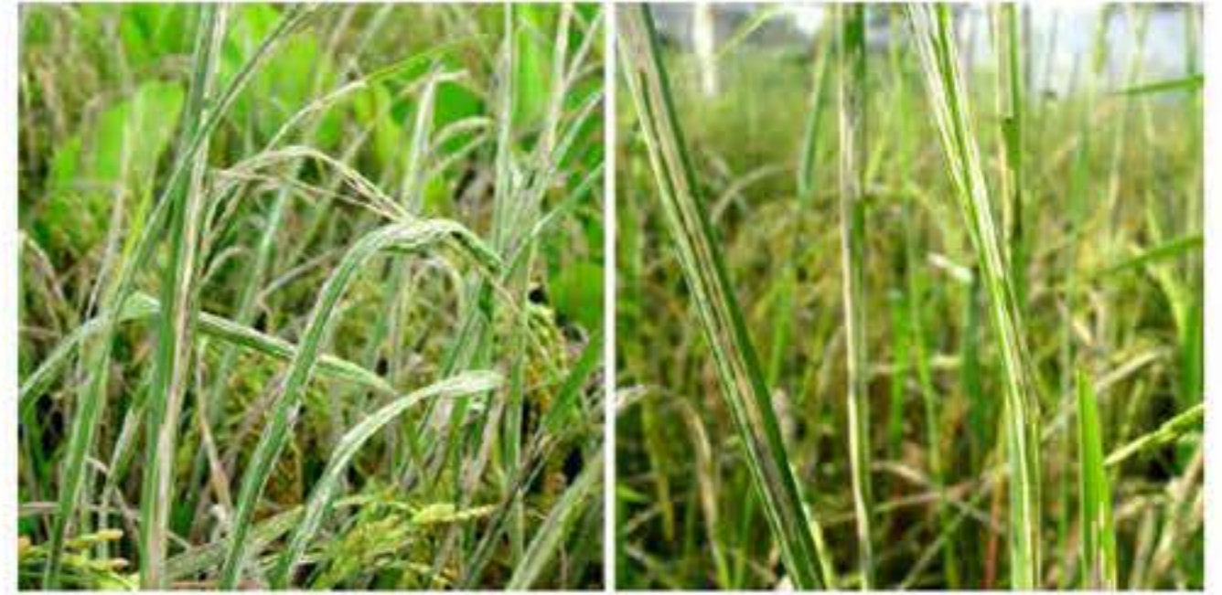
ใบข้าวที่แสดงอาการจากการทำลาย

หนอนห่อใบข้าว Cnaphalocrocis medinalis (Gueéne) ตัวเต็มวัยเป็นผีเสื้อกลางคืนปีกสีน้ำตาล เหลืองมีแถบสีดำพาดที่ปลายปีก ตรงกลางปีกมีแถบสีน้ำตาลพาดขวาง 2-3 แถบ ขณะเกาะใบข้าวปีกจะหุบ เป็นรูปสามเหลี่ยม มักเกาะอยู่ในที่ร่มใต้ใบข้าว เพศผู้มีขนาดเล็กกว่าเพศเมียเล็กน้อย เพศเมียวางไข่เวลากลางคืนประมาณ 300 ฟองบนใบข้าว ขนานตามแนวเส้นกลางใบและสามารถมองเห็นด้วยตาเปล่า ไข่มีลักษณะเป็นรูปจานสีขาวขุ่นเป็นกลุ่ม ประมาณ 10-12 ฟอง บางครั้งวางไข่เป็นฟองเดี่ยวๆ ระยะไข่ 4-6 วัน หนอนที่ฟักจากไข่ใหม่ๆมีสีขาวใส หัวมีสีน้ำตาลอ่อน หนอนโตเต็มที่มีสีเขียวแถบเหลือง หัวสีน้ำตาลเข้ม หนอนโตเต็มที่จะเคลื่อนไหวอย่างรวดเร็วเมื่อถูกสัมผัส หนอนมี 5-6 ระยะ ส่วนใหญ่มี 5 ระยะ หนอนวัยที่ 5 เป็นวัยที่กินใบข้าวได้มากที่สุด ระยะหนอน 15-17 วัน หนอนเข้าดักแด้ในใบข้าวที่ห่อตัว ระยะดักแด้ 4-8 วัน ตัวเต็มวัยจะหลบซ่อนบนต้นข้าวและวัชพืชตระกูลหญ้าในเวลากลางวัน และจะบินหนีเมื่อถูกรบกวน