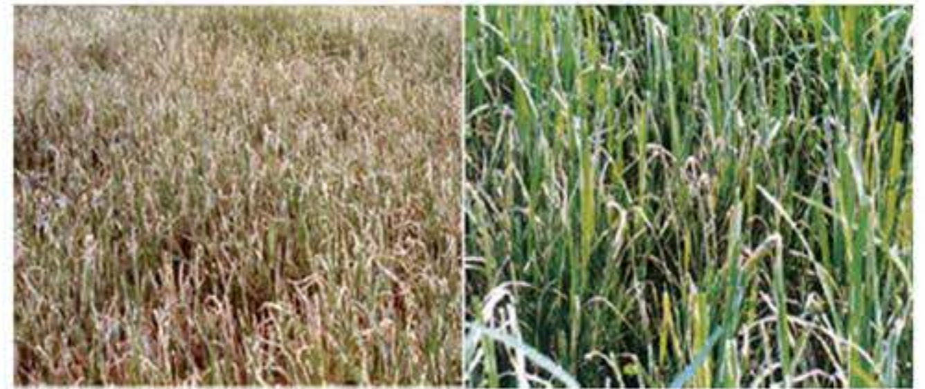
ลักษณะนาข้าวที่มีการระบาดของหนอนห่อใบข้าว